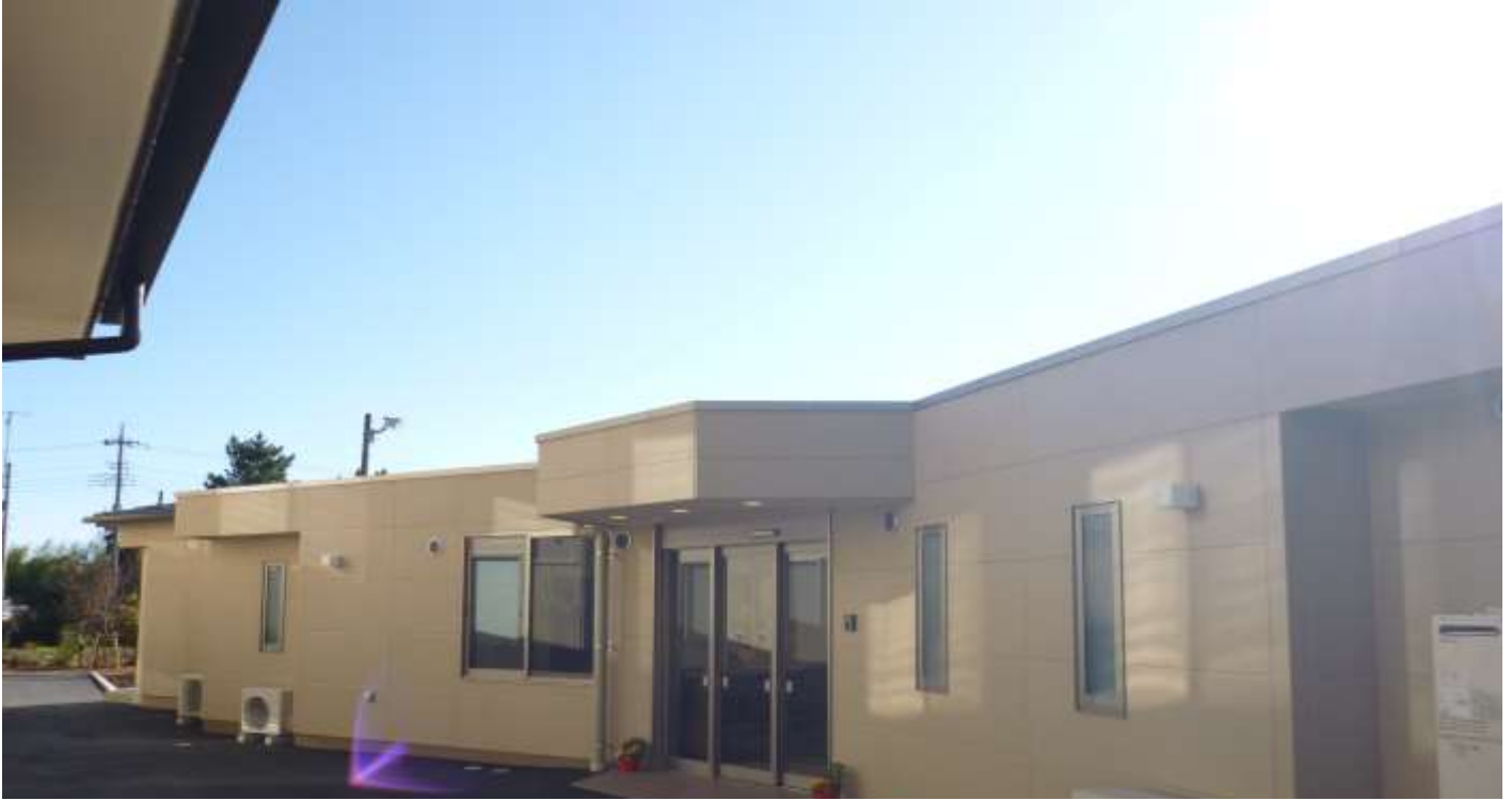
写真はグループホームコスモス細谷