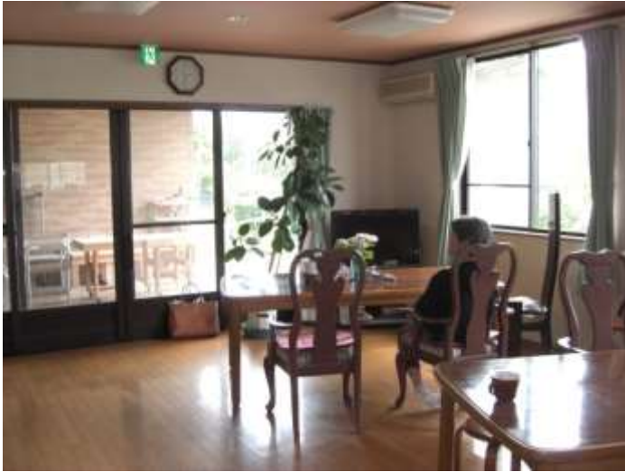
ゆったりくつろげる食堂