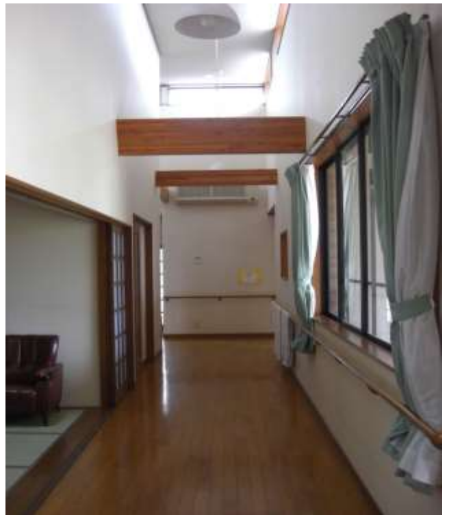
明るい吹き抜けの廊下→