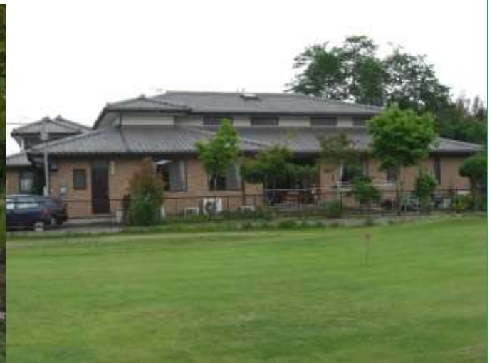
緑に囲まれた、自然が豊かで、家庭的なくつろぎ空間