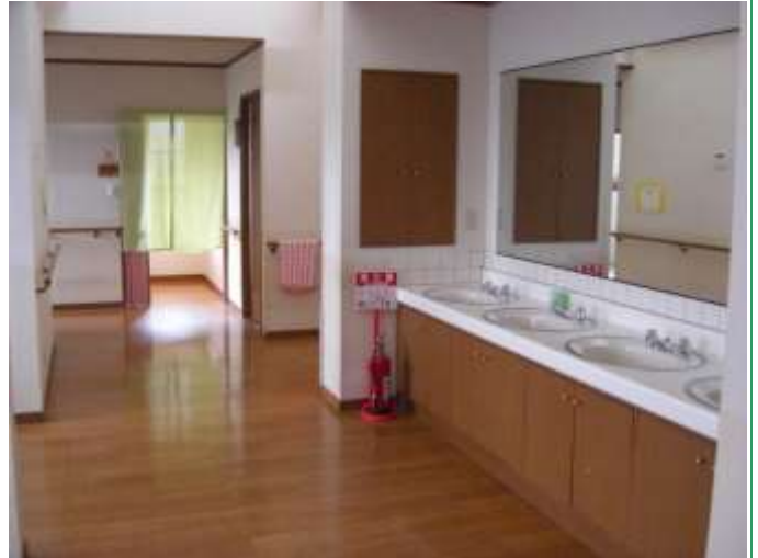
広々とした共用洗面台