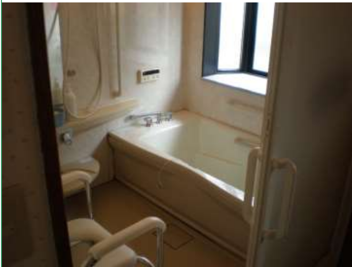
↑ ゆったりリラックスできる浴室