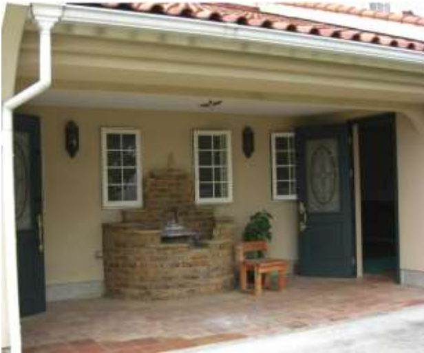
南ヨーロッパ風のおしゃれな玄関