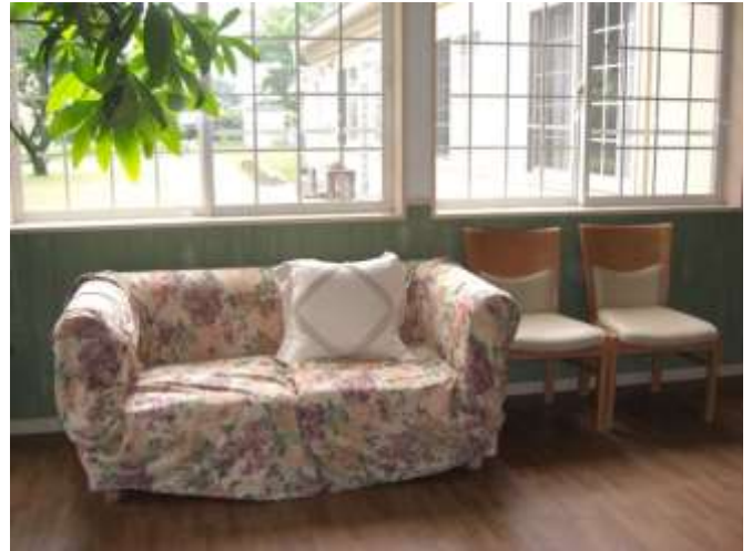
窓からの景色に癒されます。