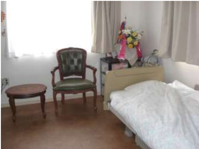
居室にはエアコン、洗面台、クローゼットが 装備されています。