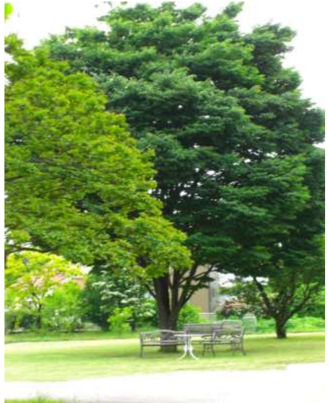
芝生に囲まれたシンボルツリー

芝生に囲まれたモダンで、清潔感とあたたかみのある建物で 落ち着いた雰囲気の中、歌やゲームなどを行い入居者や家族 職員共々毎日楽しく過ごしています。